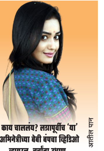
काय चालतय? तन्नापूर्वीच 'या' अभिनेत्रीचा वेबी बंपचा व्हिडिओ व्हायरल, वर्चाना उधाण..