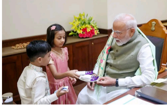
दैनिक आपला विदर्भ