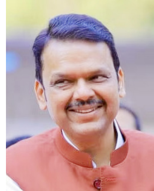
भूमिका सर्वाधिक मांडली.

ध्ये विदर्भ संदर्भात अवघ्या दोन ओळींचा उल्लेख करण्यात आला आहे. या अधिवेशनामध्ये सर्वाधिक बोलायला नवीन आमदारांना संधी देण्यात आली. नवीन आमदारांनी सर्वाधिक औचित्याच्या मुद्द्यावरती प्रश्न उपस्थित केले. सोबतच राज्यापालांचे अभिभाषण आणि २९३ च्या अन्वे चर्चावरती आपली मत मांडली. बीड व परभणीच्या आमदारांनी आपली भूमिका सर्वाधिक मांडली.